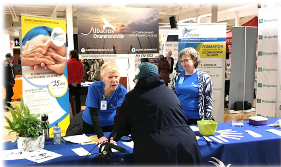
Kiosque lors d'un salon des aînés (photo à titre indicatif seulement)

Nous avons participé au Salon des aînés en octobre 2022 et remis 900 dépliant s aux visiteurs.