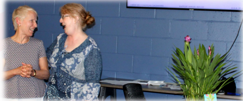
Remise d'un prix surprise à la présidente d'Albatros Drummondville