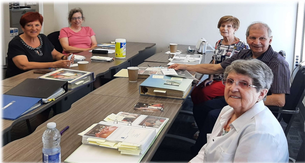
Comité informel de recherche des photographies pour le 40 e anniversaire