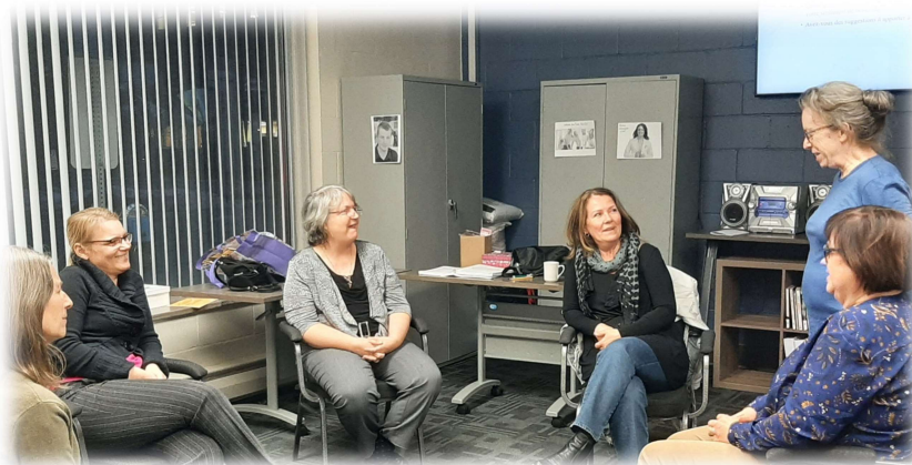
Cohorte en formation, automne 2022