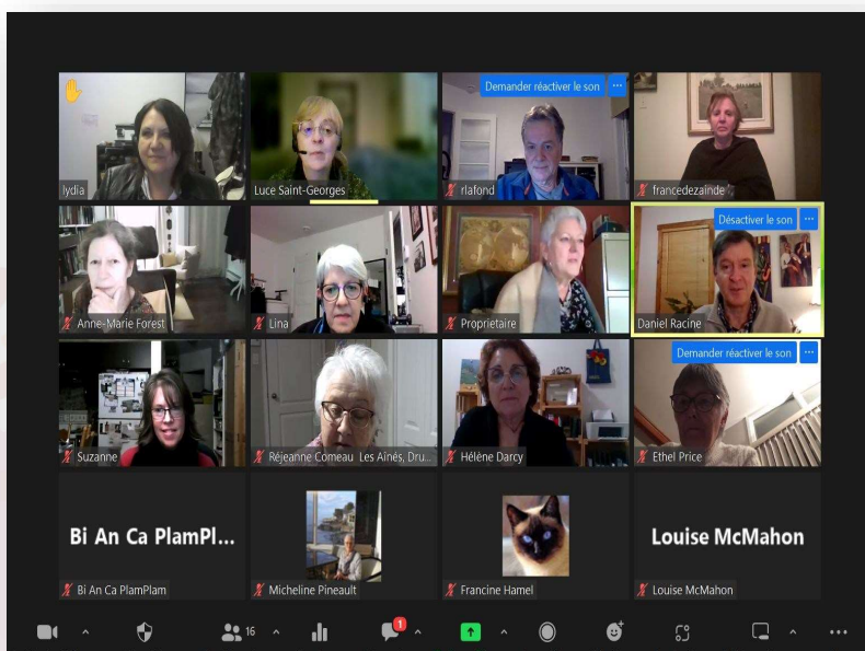
Présences lors de la conférence Zoom sur le sommeil le 11 janvier