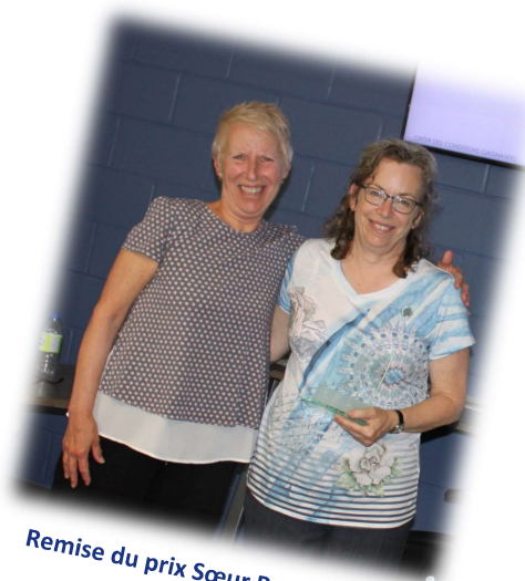
Remise du prix Sœur Pearl berg à Mme Paule Baillargeon